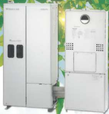
左: 燃料電池発電ユニット / 右: バックアップ熱源罐

*1. 定格出力1kW以下の家庭用燃料電池。(2020年1月東電の大阪ガス調べ) 低位稼働率基準。 *2. 余剰電力買取している場合等、3時間以上安定して定格発電を継続した際の発電効率。 上記以外の場合、定格発電効率は64% (総合発電率97%)、低位稼働率基準。