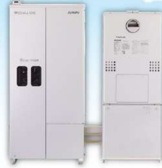
エネファームtypeS/買取り