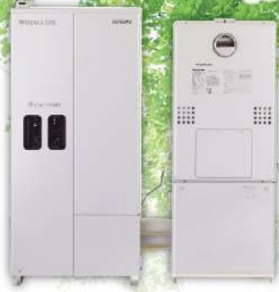
エネファームtypeS/リース