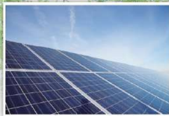
太陽光発電/リース